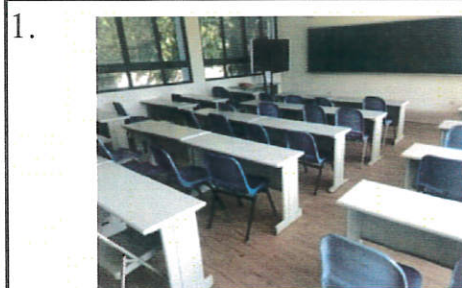
說明：自主學習教室 102