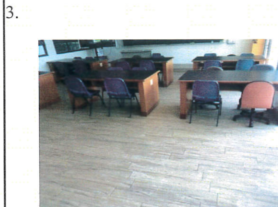
說明：自主學習教室 103