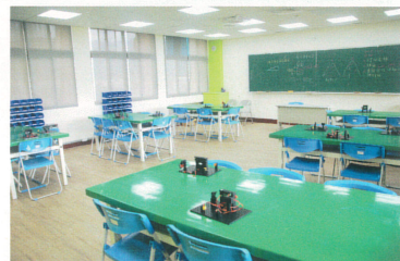
運算思維&設計思維教室